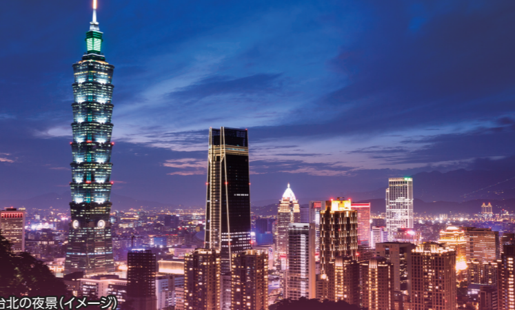
台北の夜景(イメージ)