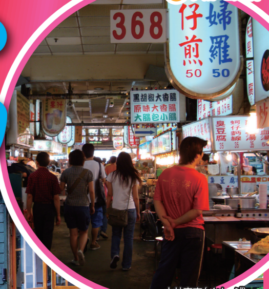
士林夜市(イメージ)